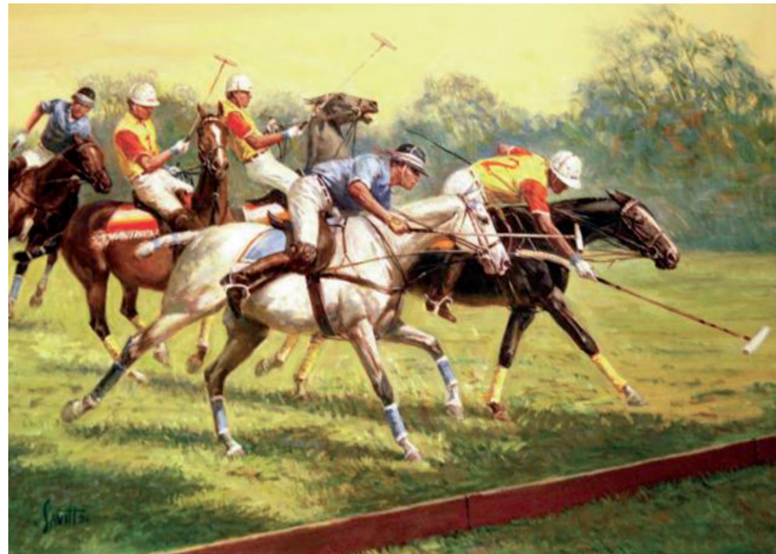
Front Cover "Mallet Work" by Sam Savitts, collezione privata

Per informazioni AIRC Comitato Toscana Tel. 055 217098